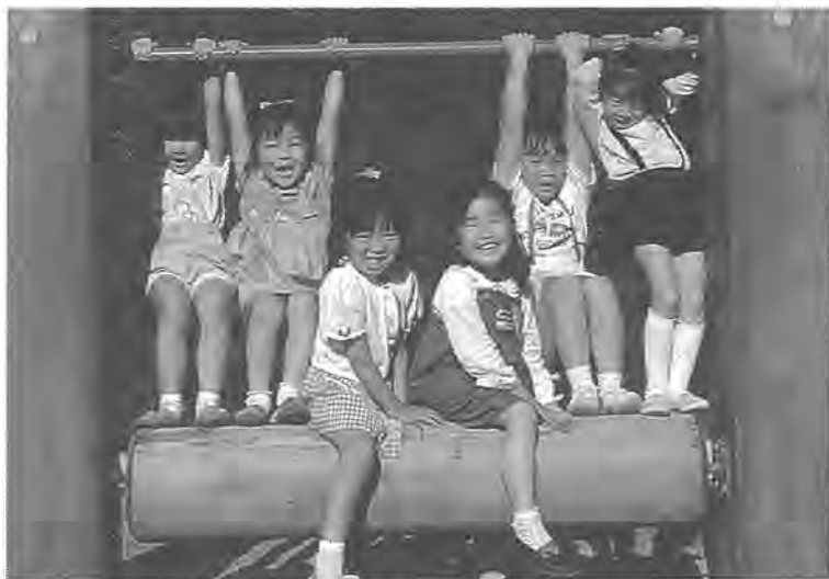
住み良い柏市にするために予算は使われています