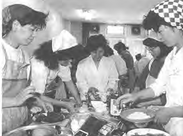
おいしく、むだのない料理作りを心がけている皆さん

「先生、塩かげんは、このくらいいいですか」「竹の子は、うまくゆったかな」、こんな会話があちこちから聞こえてきます。そのなごも、おいしそな香りが部屋いっぱい漂ってきます。