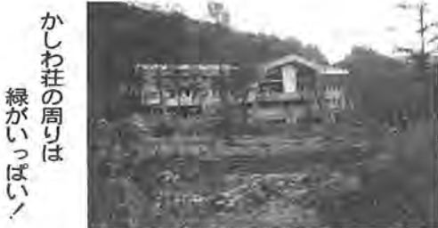
かしわ荘の周りは緑がいっぱい

（注）乳幼児（5歳以下）は無料。ただし、寝具を使用し食事をするときは、小学生扱いとなります