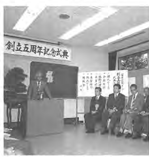
大勢の人が参加して5周年を祝いました

4時(計二十二回) ところ 上、三十五歳未満のかた、先み 中央公民館へ電話か直接 教育福祉会館 対象 市内在 着四十五人 内容 別表2の 問い合わせ 中央公民館 住・在学・在勤の高校生以 費用 無料 申し込み 64-111-1