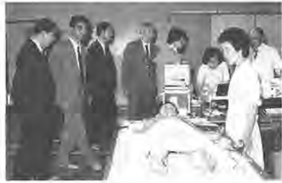
学童心臓検診を視察する考察団

承德市から考察団 友好都市提結5周年 五月二十七日、「承德市医療衛生考察団」一行が、柏市での視察を無事終えて帰国しました。