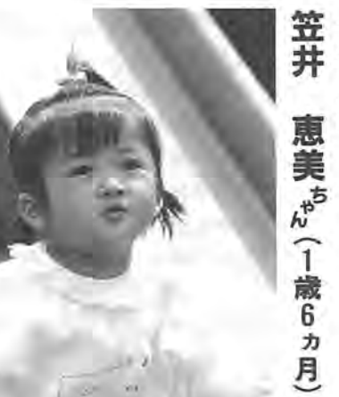
「えみちゃ〜ん」と呼ぶと「ハイ」と手を上げてお返事。“明るく、やさしい子になって”とパパとママは望んでいます。