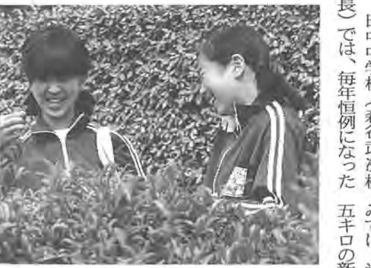
おいしいお茶になるといいね

恒例、田中中の茶摘み 田中中学校(森谷武次校長)では、毎年恒例になった茶摘みを、晴天に恵まれた五月十四日、全校生徒千八百六十人で行いました。 雨で二日延びた今年の茶摘みでは、半日の間に六百二十五千口の新茶を収穫。昨年の収穫量を大幅に上まわりました。 摘み取られたお茶は、専門の業者に加工してもらった後、PTAなどに購入してもらい、売上金は生徒会活動の費用に充てられます。