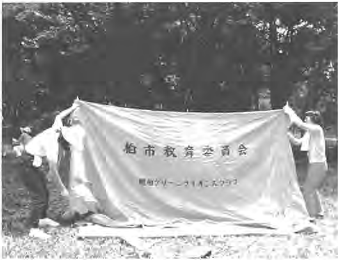
実習で、基本をしっかり体得（昨年の講習会でのテント設営）

市教育委員会では、青少年団体関係者や青少年キャンプに関心を持つキャンプ指導の初心者を対象に、キャンプ講習会を開催します。