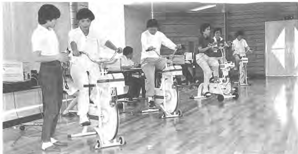
エルゴメーターで運動負荷心電図の検査(昨年の同事業から)