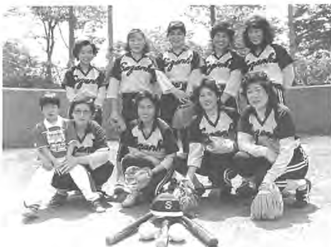
和気あいあいとした雰囲気の魅力