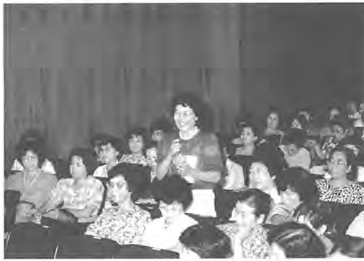
昨年の婦人大学で、真剣に学ぶ受講生の皆さん

人生八十年時代を迎え、婦人の真の自立と、積極的な社会参加を目標として、「柏婦人大学」を開講いたします。ま、何が「必要か」を探り、婦人として、より主体的に充実した生活を過ごすために、「柏婦人大学」を開講いたします。 来、女性の地位やその役割について見直され、女性を取り巻く諸問題についても、積極的に議論されるようになってきました。女性の職場についても、男女雇用機会均等法の施行や、労働基準法の一部改正など法制面での改善も徐々に進んで行きました。しかし、歴史的背景や慣習から生まれた女性に対する軽蔑や差別は、依然として根強く残っているように見えます。 学問の分野についても、近年「女性学」が台頭してきており、学問のあらゆる分野を女性の視点で意識的に捕らえようとする動きが盛んになってきています。 女性のかたは、結婚して子どもができる、就職して専業主婦になってしまつたが、多岐にわたります。そして、家庭