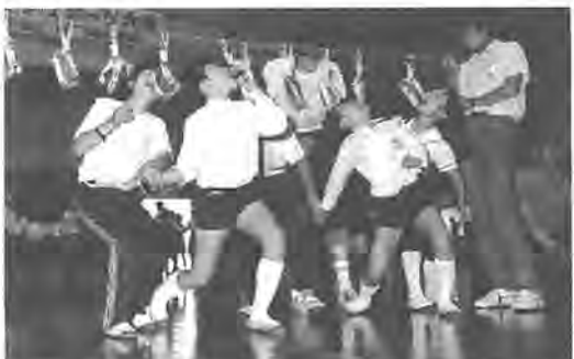
二人の息はピッタリ? (昨年のパン食い競争)

市内の心身障害者(児)が一堂に集い、スポーツを通じ釣りに関心を持ってもらい、障害者を持つかた、どなたもおと、今年も柏市心身障害者(児)スポーツ大会を開催します。 また、一般の皆さんの見学・応援も大歓迎です。ぜひご来場ください。 とき 6月12日(日)午前9時半～午後3時半 ところ 市民体育館 申し込みと問い合わせ 5月20日(金)までに柏市社会福祉協議会事務局 ☎63-19001