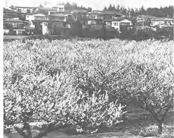
柏市議会議長賞「梅咲く家並み」