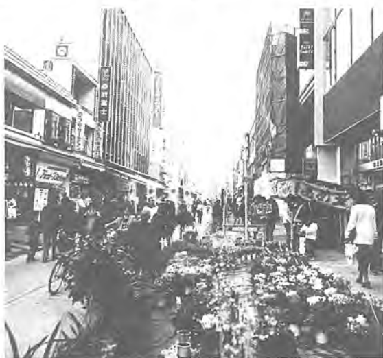
柏市長賞「駅前歩行者天国」