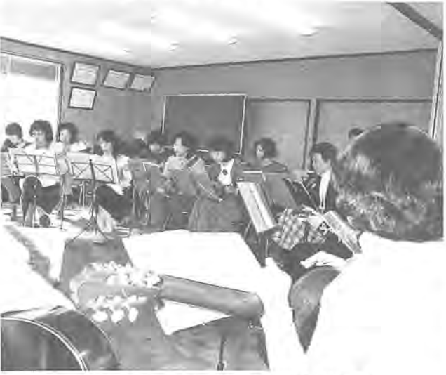
演奏会を前に練習にも熱が入ります

練習会場に優しいトレモロの響きが流れ、聴く人の心の安らぎの中へといざなっています。今回ご紹介するのは、「柏マンドリンクラブ」の皆さんです。発足は昭和五十九年二月。新聞広告で集まった仲間七人でスタート。現在では会員も二十七人に増えて、年齢の層も三十代から七十代までと幅が