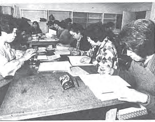
地道な作業に取り組む会員のみなさん

「これからは、電気製品 の使用説明書など、生活に 密着したもの」の点訳に、 力を入れていきたいとか。 市でも、点字の文書を、 とチクリ。問い合わせは、 市川さん 電話43-16670