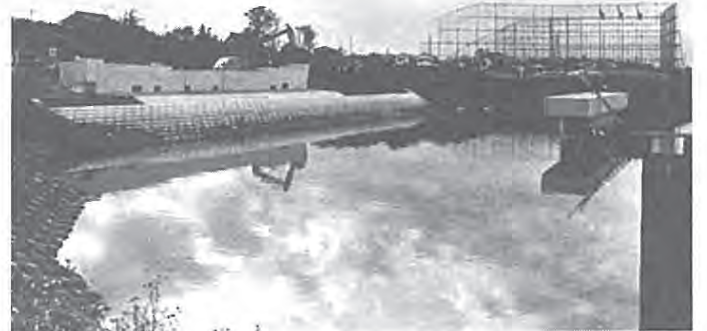
改修工事が進む大堀川

市議会昭和62年第4回定例会(12月議会)は、12月4日に招集。18日まで、別表の日程で開かれています。今議会では、大堀川右岸第8号雨水幹線工事の請負契約の締結、一般会計補正予算など、当初9議案が上程され、審議が行われています。今号では、主な議案と鈴木市長の市政報告について、お知らせします。