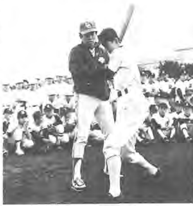
徒を前に、まず、練習にあたっての心構えから説明。「スラッシュ」には礼儀が大切。グラウンドに入るときなどは、必ず「練習のとき、試合のとき、気づいたことはメモに取っておき、後で参考に」などの話の後、実技の指導に入りました。写真は、素早いキャッチボールに心掛けること、けがをしないスライディングを、などと、手取り足取り、約一時間にわたり、刃りが薄暗くなるまで熱心に指導を行いました。

市民体育館敷地内に建設を完了した、相撲場が完成式典を行いました。十一月二十三日(月)に、真(しゅん)工式が行われ、木造五十二・八五平方尺、百人が入れる芝生の観覧席を備え、総工費は千四百七十万円。