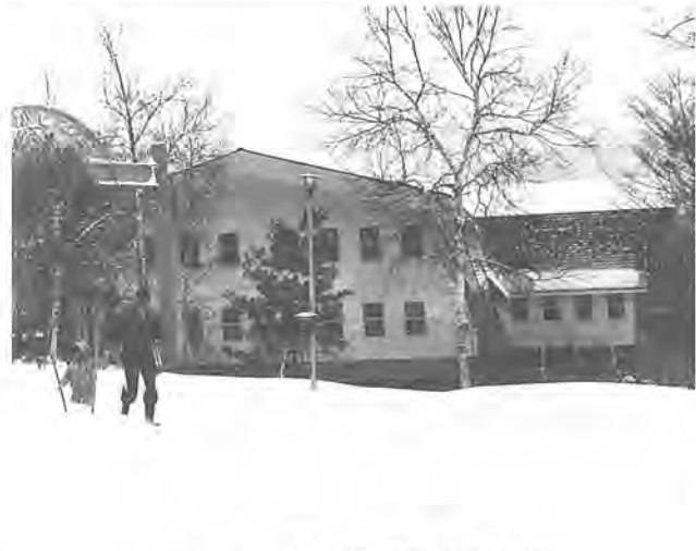
白銀に包まれた菅平かしわ荘