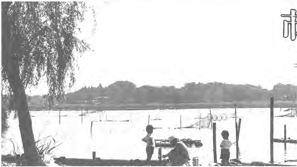
市民のいこいの場、手賀沼の将来は...