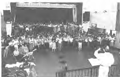
熱のこもった練習風景

とき 10月14日(水)~21日(水) 午前8時半~午後5時 (土曜日は午後0時半まで) ところ 市役所第二庁舎一階市民ロビー 内容 家庭から手賀沼までの、生活雑排水の流れを説明した写真を中心として展示し、ビデオの上映も併せて行います。 問い合わせ 環境対策課 ☎63-4422