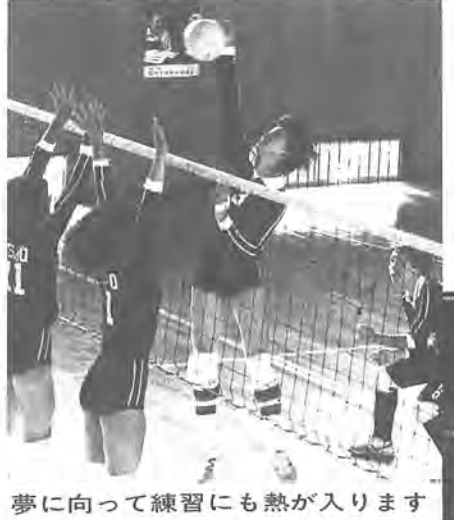
夢に向かって練習にも熱が入ります