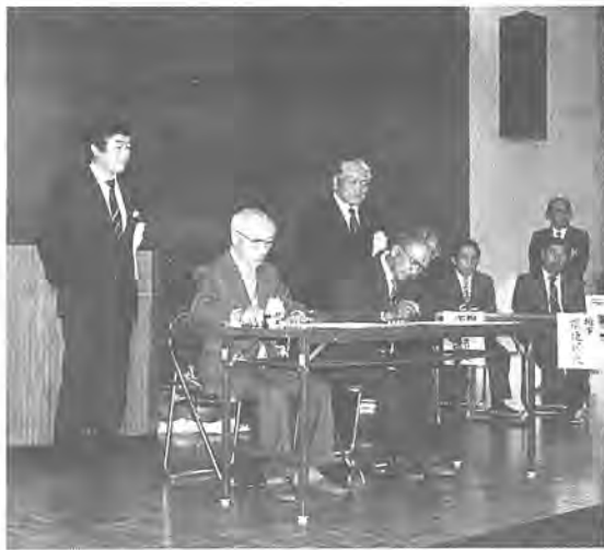
環境美化ふるさと交流協定書調印式