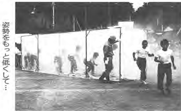
姿勢をもっと低くして...

市では、皆さんに市政への関心を深めていただくこと、「柏市民自治大学」を開きます。講義や映画を通して、あなたも市政について勉強してみませんか。 とき・内容 別表のとおり 時間はいつでも午後1時半～3時半 ところ 教育福祉会館 対象 市内在住の成人、先着四十五人 参加費 無料 申し込み 9月12日(土)午前10時から中央公民館へ電話か直接 問い合わせ 中央公民館 ☎64-1111