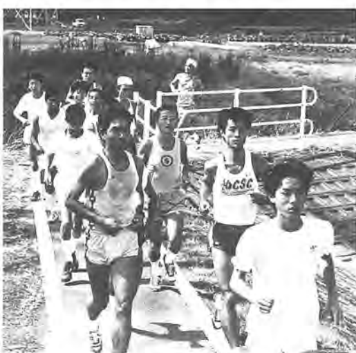
手賀沼沿いを仲間と快走

走ることを通じて、健康づくりとふれあいを深めているみなさんがいます。 昭和五十七年、市のジョギング教室終了生が中心となって発足した柏CSC(コミュニティ・スポーツ・クラブ)。第一日曜日と家族スポーツの日の第三日曜