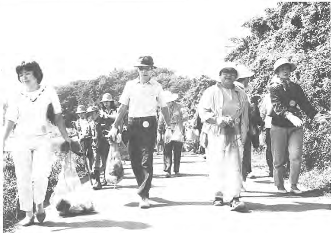
子どもからお年寄りまでたくさんの市民が参加しました ＝昨年の手賀沼クリーン・ピクニックから