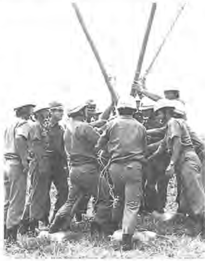
力を合わせて水害防止

七月三十日、柏市・我孫子 工法を学ぶもので、両市の市共催の水防演習が布施の利根川堤防で行われました。消防団員三百四十五人、消防職員八十人が参加しました。演習は台風シーズンを前に、堤防の決壊を食い止める