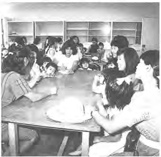
真剣な表情の中にも和やかな雰囲気

「子どもに、どんな絵本を、ちが集まり、悩みを共に解消与えたいのかしら」「近して行こう」というのが「ヤン所」に同じ年ごろのお友達が「グミセス子育てセミナー」の「子どもに、どんな絵本を、ちが集まり、悩みを共に解消