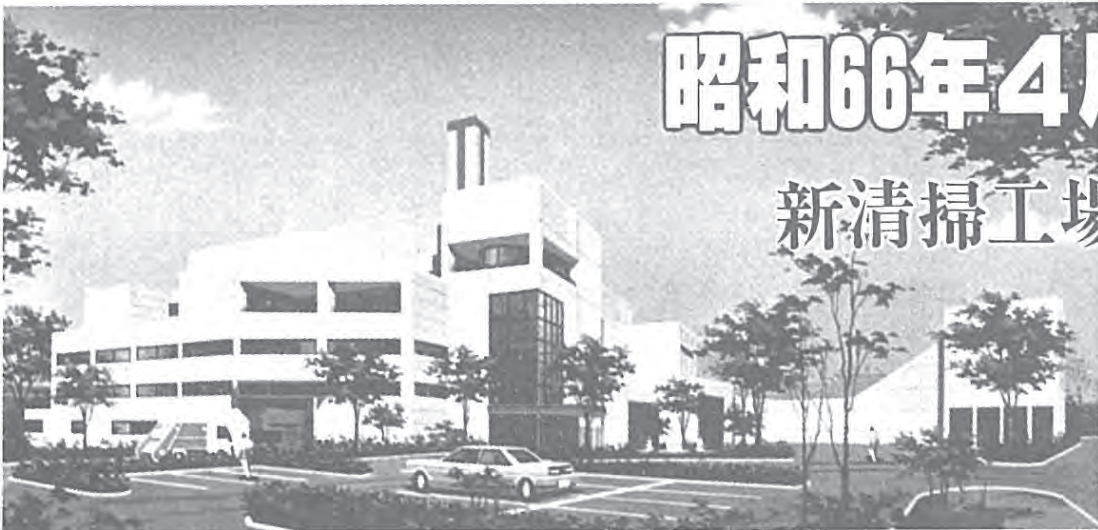
周辺の環境と調和した新清掃工場（完成予想図）

新清掃工場建設工事の請負契約議案が、六月の定例市議会で可決され、いよいよ建設工事が始まります。新清掃工場は、現在の船戸清掃工場の敷地内に建設され、建設工費は六十二億四千万円。流動床方式を採用した焼却炉（百ト）を三基備え、昭和六十六年四月、本稼働を予定しています。今号では、新清掃工場について紹介します。