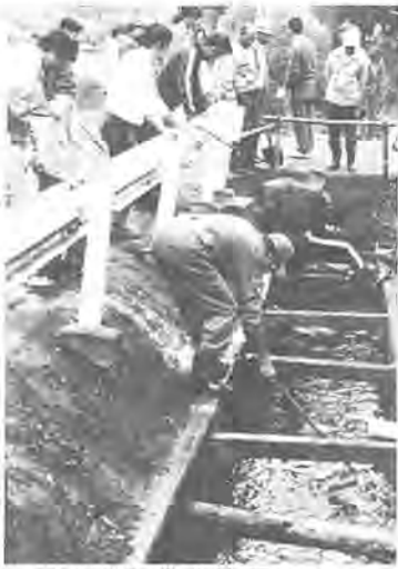
永楽台町会全体で行われた側溝清掃