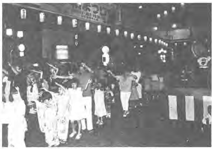
大人も子どもも一つの踊りの輪に

柏市教育委員会では、このほど「柏市教育計画」を七年画は、生涯教育を理念にすえに、訓練するのが目的。四平方の敷地に、園舎がそれぞれ二棟と農場のほか、市内三カ所に延べ約四千平方の農場があります。