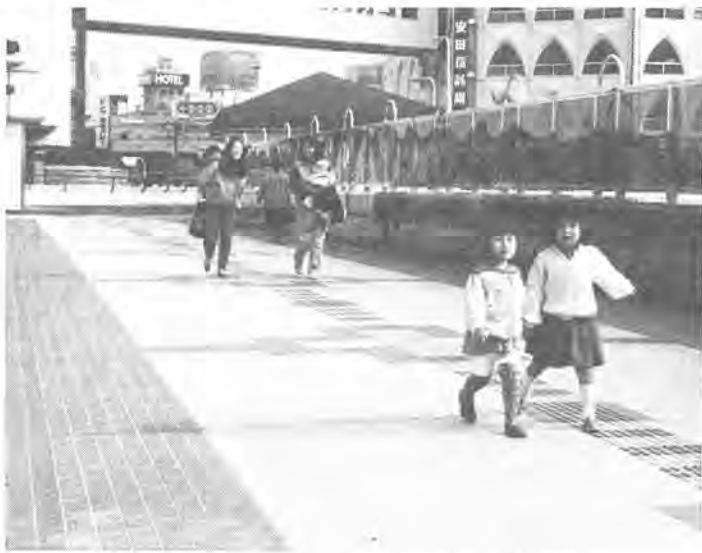
交番わきから西口へのびる北側自由通路