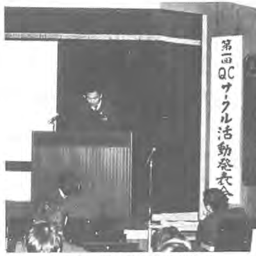
市民サービス向上のため活動成果を発表する市職員

二月十七日、教育福祉会館で、市役所職員による「第一回QCサークル活動発表会」が行われました。 QCサークル活動は、「自分の職場内の仕事を自分たちで改善し、生産性の向上」を目的に、民間企業で始まった活動です。 市役所でも、市民サービス向上と諸経費の節約を目指し、昨年六月から開始。現在、二十一のサークルが活動しています。当日発表したのは、そのうちの六サークル。