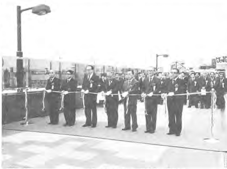
テープカットが行われた南側自由通路

柏駅南北自由通路橋が完成、二月二十日に開通式が行われ、市長は「南北自由通路の完成は、柏駅東西周辺整備事業の推進にも大きく役立つものであります」とあいさつしました。このあと、南側自由通路でテープカットが行われ、渡り初めをして完成を祝いました。同橋は、柏駅の混雑緩和、東西の市民の利便と商店街の繁栄を図るために、柏駅の東西を高架で結ぶ自由通路。柏駅をまたぐように、松戸寄り