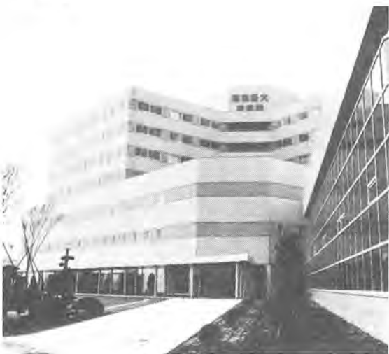
地上7階建ての病院本館

四月一日、東京慈恵会医科大学附属柏病院が柏市柏下に開院します。診療科目十四科、救命救急センター的な、第三次救急医療のレベルを備えた、高度の医療を提供できる総合病院です。地元医師との連携を密にして、地域医療の中核的病院をめざす同病院を紹介いたします。