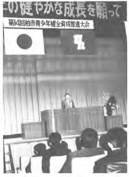
体験発表も行われ、大会は盛り上がりしました

二月十四日、柏市民文化会館大ホールで、市立中学・高校の生徒や青少年団体関係者など千三百人が参加して、第十四回柏市青少年健全育成推進大会が開かれました。 この大会は、価値観の多様化など、青少年を取り巻く環境が著しく変化しているなかで、次代を担う青少年の心身