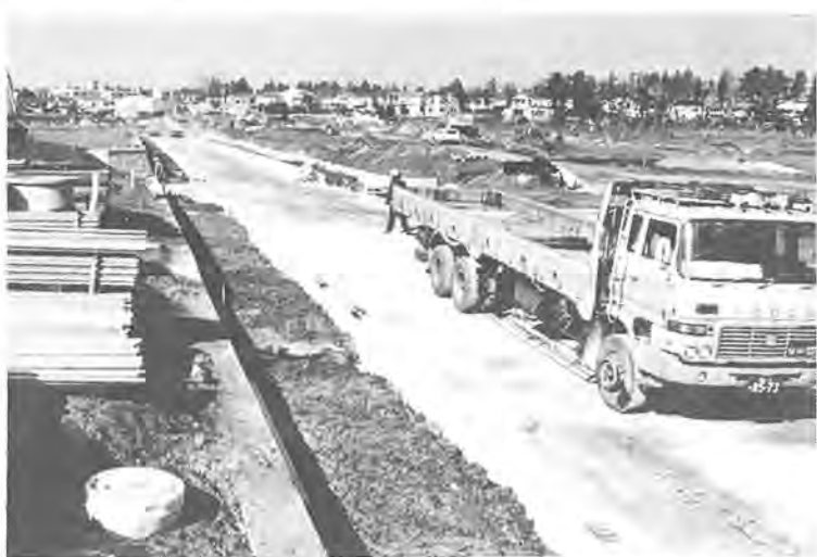
② 着々と工事が進む逆井・藤心土地区画整理事業