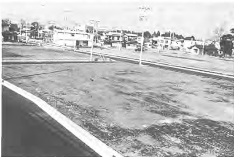
① 完成間近な根戸中馬場土地区画整理事業