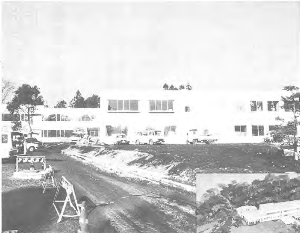
四月の開校に向けて工事が進む日本橋女学館短期大学(上)と完成予想図(右)

問合せ 同短期大学設置準備室 ☎三ー662ー二五〇七(2月23日以降は☎67ー八六五五)