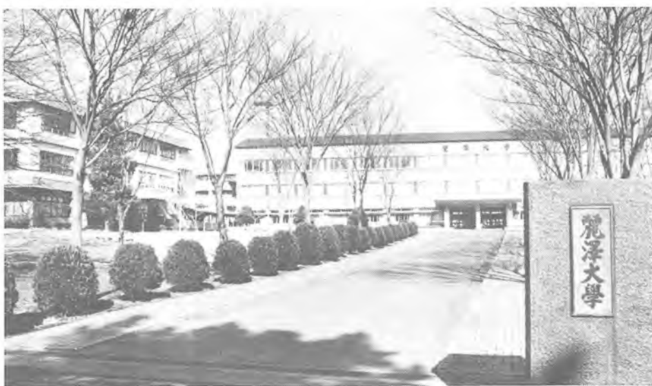
緑が多く、広いキャンパスをもつ麗澤大学