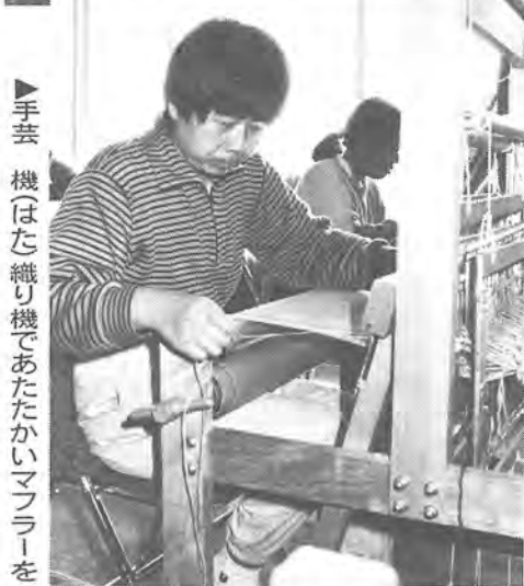
▶手芸 機はた織り機であたたかいマフラーを

毎日の忙しい生活の中で、その礎(いしずえ)となる『健康な心身』は、つい忘れがちなものです。しかし、『健康な心身』というものは、いつ、どこで失われるかわかりません。交通事故や病気など、私たちの身近には、多くの危険がふられています。健康な皆さんも、いつ障害者になるかわかりません。障害者の問題は、皆さんにも身近な問題なのです。十二月九日は、『障害者の日』。今号では、利根川沿いにある精神薄弱者更生施設「みどり園」(我孫子市中峠)の一日を、写真で紹介します。