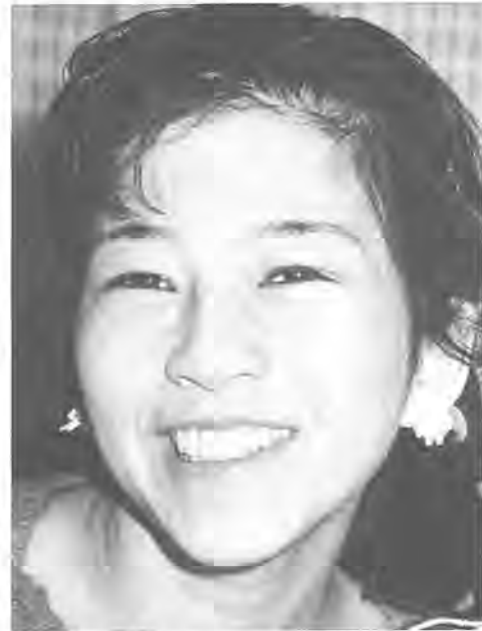
日本音楽コンクール声楽第1位の