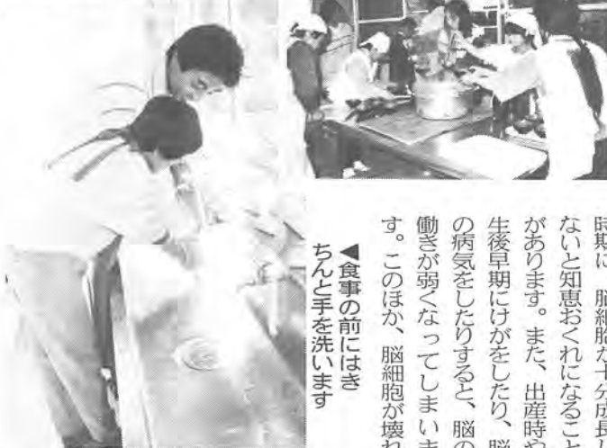
▶食事の前にはきちんと手を洗います