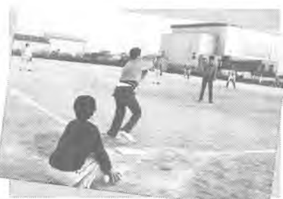
▶余暇指導 職員とソフトボール

体を使って仕事をすることによって、持続性・協調性・創造力を養います。農耕、園芸、木工、手芸、陶芸、工芸の6種類の作業を通じて、働く喜びを体得します。