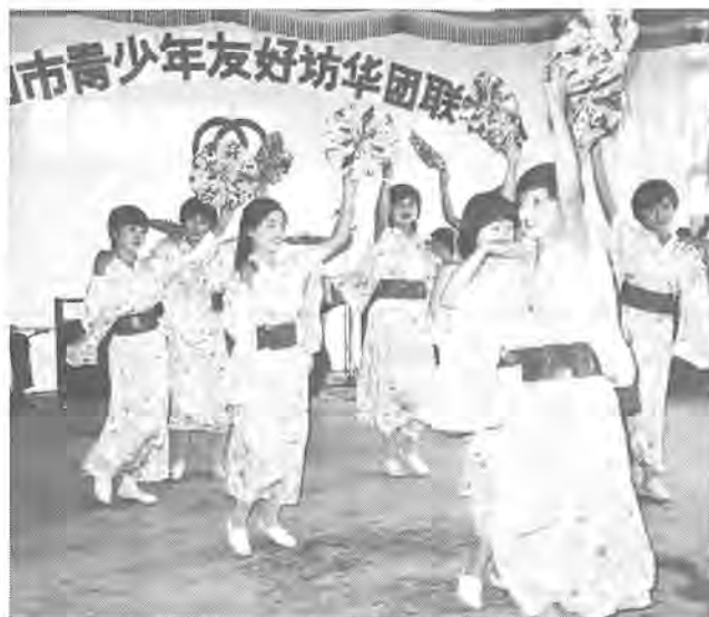
承德の青少年が踊ってくれた花笠音頭

最後に「幸せなら手をたたこう」を一緒に歌った時の感激は、生涯忘れることのない思い出となりました。