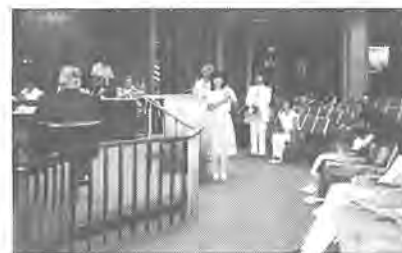
議場で手話を 使ってあいさつ

これからトランスを訪れたいと考えている人々には、「ひとに何を求め、何を残せるのか」という目で自分を見つめて欲しいと思います。確かにアメリカのアイスクリームはおいしかったけど、私が一番おいしかったアイスクリームは、ホストファミリーが総出で作ってくれたものでした。そこには、私を満足させる家族の心のぬくもりがあったからだと思います。