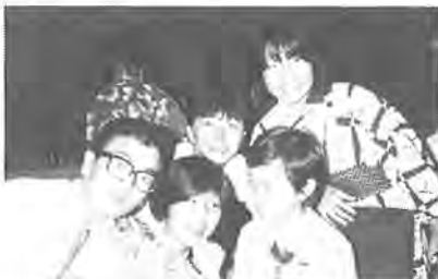
承德の青少年と記念写真

これから、あらゆる機会をとらえて、この夏の貴重な体験とすばらしい感動を周囲の人々に正しく伝え、柏市と承德市の永遠にわたる友好交流に少しでもお役に立ちたいと考えています。