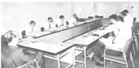
婦人問題を検討する庁内連絡会議

また、十月九日以降に転居届けをした場合、投票所入場整理券は、前の住所地に発送されますので、郵便局への転居届けもお忘れなく。