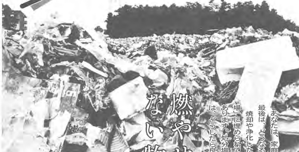
最終処分場 (9月8日撮影)