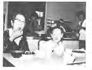
お年寄りも、好物を注文し

くほえんでいました。なお、これから高齢化社会を迎えるに当たり、市では寝たきりや独り暮らしのお年寄り等に対する在宅福祉サービス。老人福祉施設の充実。生きがい対策としての老人クラブや各種スポーツの普及、高齢者事業団の育成等の老人福祉施策を進めています。 お年寄りも、好物を注文し お年寄りも、好物を注文し お年寄りも、好物を注文し