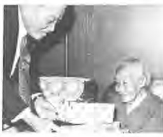
市長が長寿者訪問

九月九日、敬老の日になんだ「長寿者訪問」が行われました。民生委員のかたがたが、市内に住む満九十歳以上のお年寄り二百三十人を訪問し、長寿を祝い記念品を贈りました。