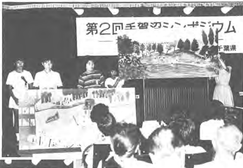
「手賀沼の未来図」を 発表する子どもたち(右)