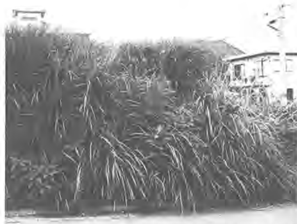
今、空き地では雑草が伸びほうだいとなっています

十一月一日から柏駅に停車することになった特別急行列車「ひたち号」の停車時刻が、このほど決まりました。国鉄の 特急「ひたち号」 発表によると、上り・下り各五本で、次のとおりです。 ●上り（上野行き） ▽10時28分 ▽16時28分 ▽18時29分 ▽19時27分 ●下り（内は行き先） ▽7時52分（原ノ町） ▽8時59分（水戸） ▽10時53分（勝田） ▽16時53分（水戸） ▽19時53分（水戸） なお、中距離電車は、上り・下りともに六本増発されることになっています。