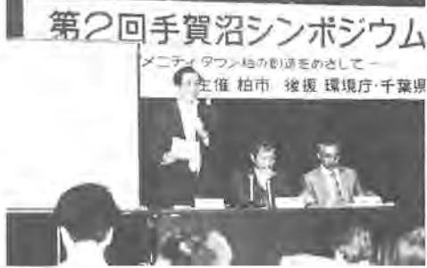
第2回手賀沼シンポジウム メニティ(タフ)柏の創設をのこして 主催 柏市 後援 環境庁・千葉県

八月九日、「第二回手賀沼 シンポジウム」(柏市主催、 環境庁・千葉県後援)が教育 福祉会館で開かれました。手 賀沼浄化への市民の関心の高 さをうかがわせるように、当 日はいす席が二百人分しかな い会場に約三百五十人がつめ