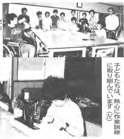
福祉作業所の完成を喜ぶ会員の皆さん(右)

明るい雰囲気の中で、障 害を持つ子どもたちを暖か く見守っているのは、「柏 市肢体不自由児を育てる 会」の皆さん。 子どもたちは、熱心に作業訓練 に取り組んでいます(左)