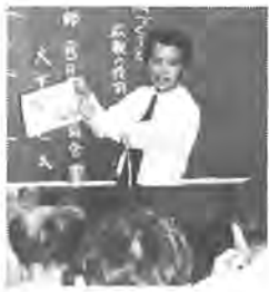
「あつ、そつ」でおしま

この研修会は、近隣センター運営協議会の役員や広報担当者などを対象に、市が開催したもので、約三十人が参加。初めに「地域づくりのための広報の役割」と題し、日本広報協会の天下勝巳氏が講演。「だめになる広報」で