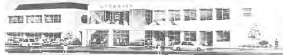
来年4月オープン予定の(仮称)柏市保健・勤労会館(完成予想図)

昭和六十一年第二回定例市議会が、六月十九日までの予定(別表参照)で、開かれています。この議会では、来年四月にオープン予定の(仮称)柏市保健・勤労会館新築工事など、十八議案が提出され審議中です。これらのうち主なものを紹介します。