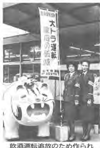
飲酒運転追放のため作られた柏署の大トラ

昨年三月二十日、柏市は平和都市宣言を行いました。この一年、姉妹都市による国際交流、宣言プレートの掲示、平和を考へるビデオ展、図書展などの啓発活動を実施してきました。今年度も平和を願う諸事業を進めていきます。