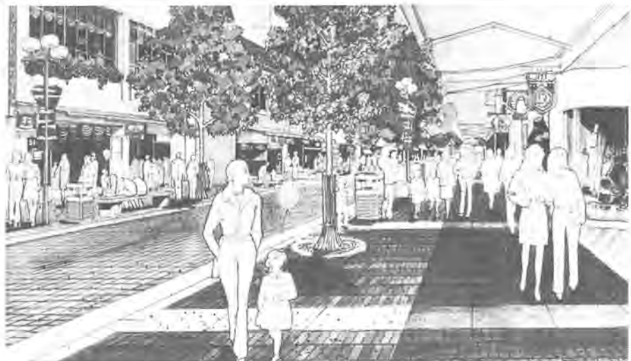
歩道を広げて街路樹、ベンチなどを配置した完成予想図