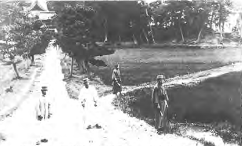
明治44年の布施弁天の参道の様子。当時の人々の服装も興味をひきます