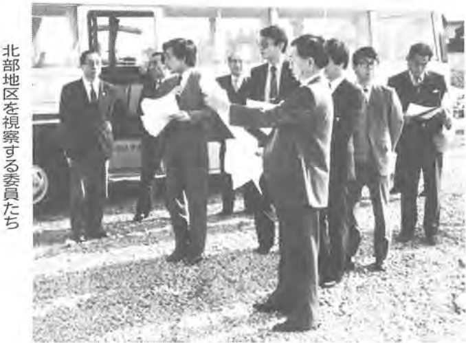
北部地区を視察する委員たち

川区・台東区・千代田区(以上「東京都」)、守谷町(茨城県)の九区市町村からなるものです。同協議会は、今後①国・都