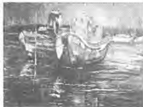
旭日の大利根河中の廃船