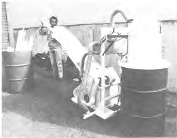
導入が決まった蛍光管破砕機 (写真は同型機)

市では、四月一日から蛍光管の分別収集を行うことになり、可燃物(燃えないゴミ)収集