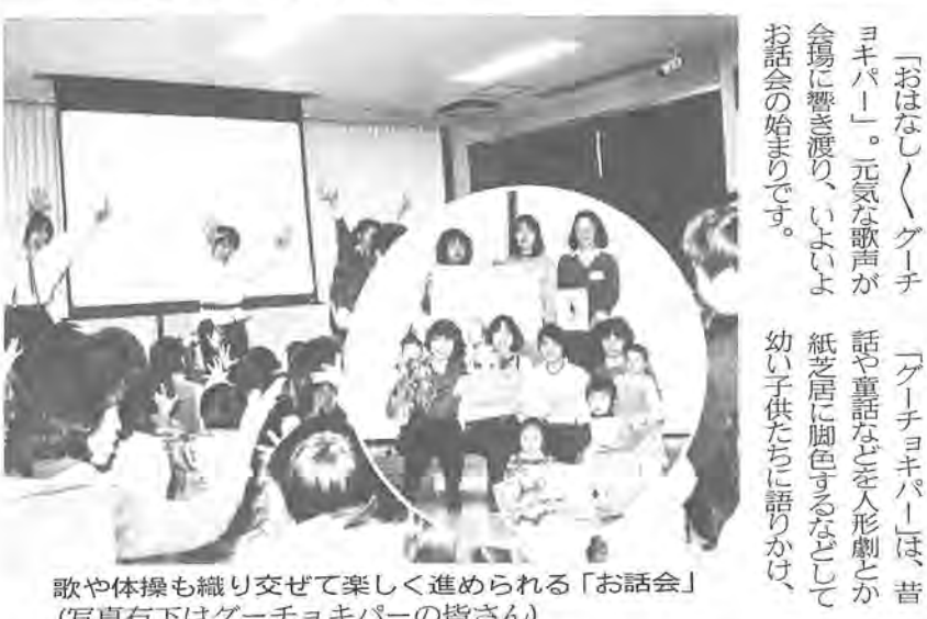
歌や体操も織り交ぜて楽しく進められる「お話し会」(写真右下はグーチョキパーの皆さん)

「おはなし」グーチョキパーは、昔話や童話などを人形劇とか紙芝居に脚色するなどして、幼い子供たちに語りかけ、