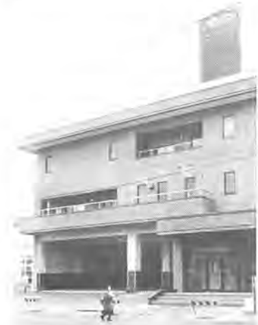
完成した東部消防署 =1月下旬撮影

東部消防署 新庁舎で業務開始 常磐線東側の防災拠点に 東部消防署は、二月八日から新庁舎(中央二丁目10-13)別図、☎64-0111で業務を始めました。これは、老朽化した旧庁舎を壊し、昭和五十九年末から増改築工事を進めていたもの。 完成した新庁舎は、鉄筋コンクリート造りの三階建て。延べ床面積は、約千七