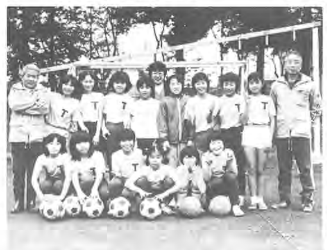
サッカーの楽しさに魅せられた女子チームのみなさん

日曜日の午後、柏六小の校庭に、女の子の声かひとさわ高く響きます。のぞいてみると、女子サッカーの練習が行われていました。十五年の歴史をもつ豊四季少年サッカークラブは、部員が約三百人という大所帯。その中に、女子チームが結成されたのは、昨年のこと。現在、部員は、小学四年生から六年生までの十八人。