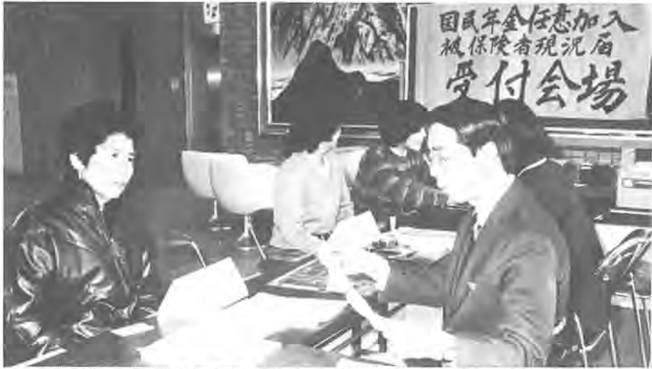
1月31日までの休日を除く毎日、市役所(第二庁舎)1階ロビーで、届け出を受け付けています

届け出は、次のとおり郵送または直接窓口へ提出してください。 ①郵送の場合 届け出用紙に必要事項を記入し、ご主人(あなたの配偶者)の勤務先で確認(証明)を受けたうえで未加入のかたは4月以降に一方、国民年金に加入していないかたについては、今年四月以降に届け出をさせていただきます。あなたの配偶者が共済組合の年金に加入している場合は、共済組合法が改正されましたので、後ほど、必要な届け出をしていただくこととなります。もうしばらくお待ちください。 対象者の半数が届け出済み 市内で国民年金に任意加入