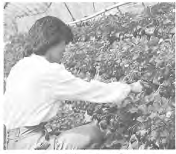
いちご狩りも楽しめます

お座敷列車「柏市民号」で、早春の駿河路を訪れ、いちご狩りを楽しみながら、市民相互の交流とふれあいを深めてみませんか。