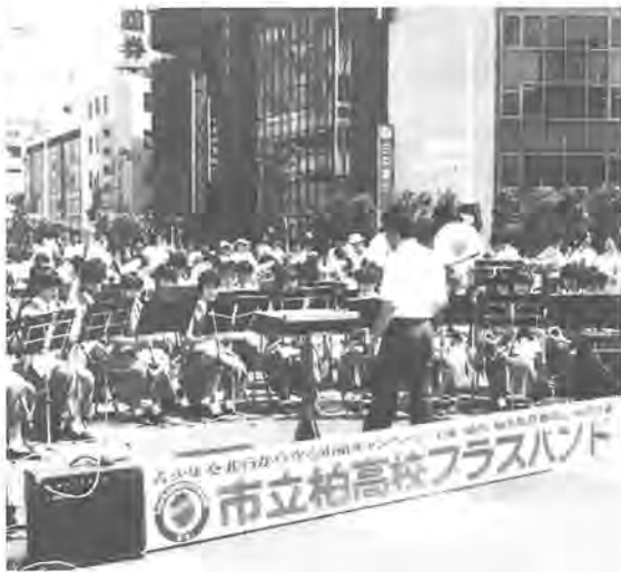
非行防止キャンペーンで演奏する市立柏高校吹奏楽部の皆さん

入場料を恵まれないかたのために、役立てる「第三回チャリティーコンサート」を、市立柏高校吹奏楽部が開きます。