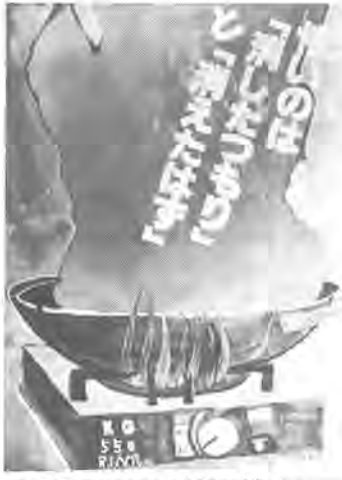
秋季柏市火災予防運動のポスター

▽7日・8日午前10時、午後4時、教育福祉会館四階会議室 【対面朗読コーナー】 朗読奉仕サークルが対面朗読を行います。▽7日・8日午前10時、午後4時、教育福祉会館二階図書室 【写真展】 障害者が撮った写真などを紹介します。▽7日・8日午前10時、午後4時、教育福祉会館五階ホール 【軽食コーナー】 ボランティア団体が、おにぎりやおでんなどを用意してお待ちしています。▽7日・8日午前11時、午後4時、教育福祉会館四階集會室 ◎問い合わせ 詳しくは柏市社会福祉協議会63-1-9001へ。