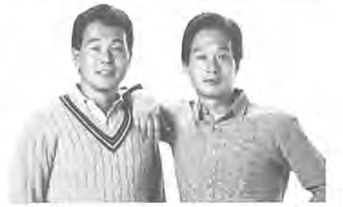
白いブランコでおなじみのピリーバンパン

【映画会】 白血病と闘いながら、運命への過酷さに対する怒りの挑戦を描いた作品「ジョーイ」を上映。▽8日午前10時、正午、教育福祉会館二階中央老人福祉センター／先着百五十人