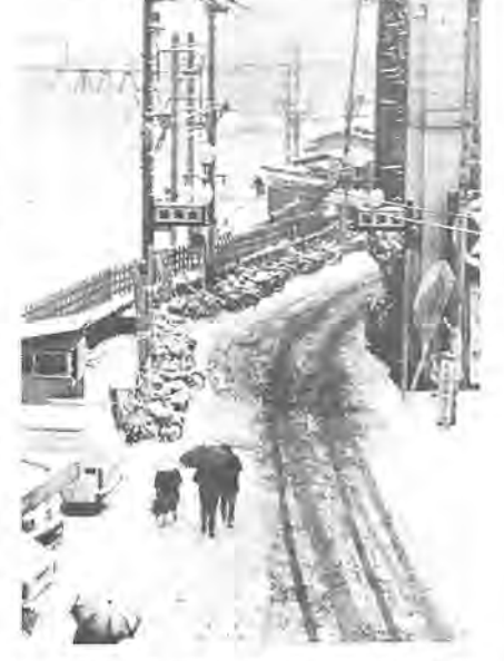
第5回ふるさと柏写真展から 作品はカラー