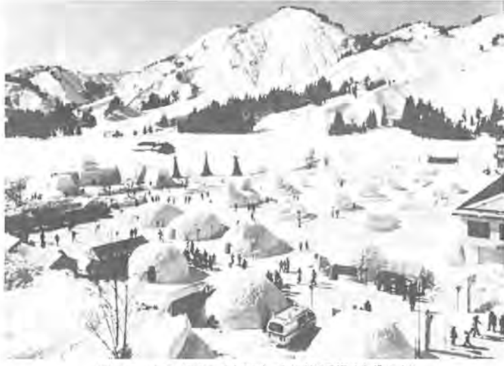
雪まつりの会場にはかまくらや雪像がずらり