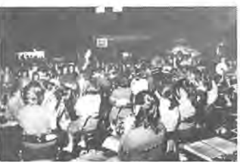
人でいっぱいだった芸能祭