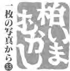
一枚の写真から 柏いま むかし

東武野田線の「逆井駅」は、昭和八年七月に、「逆井停留所」として開設されました。この停留所というのは、駅よりも簡易な施設のことですが、開設の背景には、「大正十四年、土村村長らが鉄道会社に逆井停留所設置の陳情を行う」など、執拗ともいえる住民運動がありました。 当時、総武鉄道(昭和十九年に東武鉄道と合併)船橋線とい