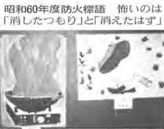
昭和60年度防火標語 怖いのは「消したつもり」と「消えたはず」

今年十一月二十六日から十二月二日にかけて、秋の火災予防運動が繰り広げられますが、同運動の一つとして開催される「防火ポスター展」の作品審査が十月十五日に柏市消防本部で行われ、特別賞二点を含む入賞作品三十五点が決まりました。