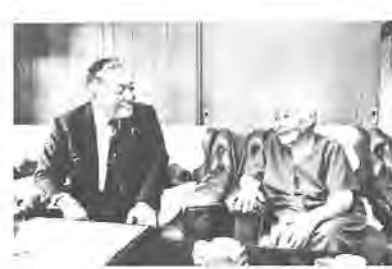
うながが好きです」と家族のかたは話していました。