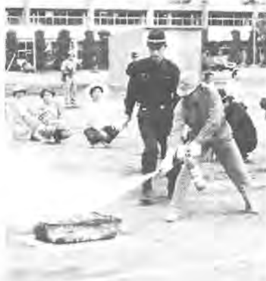
初期消火訓練(昨年の訓練から)

「防災の日」の今日九月一日、 市内二つの会場で、防災訓練を行 います。中央会場の光ヶ丘中学校 校庭では、直下型大地震の発生を 想定し午前十時から正午まで、訓 練を実施します。 この訓練は、千葉県をはじめ東 京都・神奈川県・埼玉県・横浜市 ・川崎市の六都府県による合同防 災訓練の一つとして行われるので、 関東大震災規模の大地震(マグニ チュード七・九、本市の震度六 烈震)が発生し、市内全域にわた りかなりの被害が発生したことを 想定して、避難誘導・初期消火・