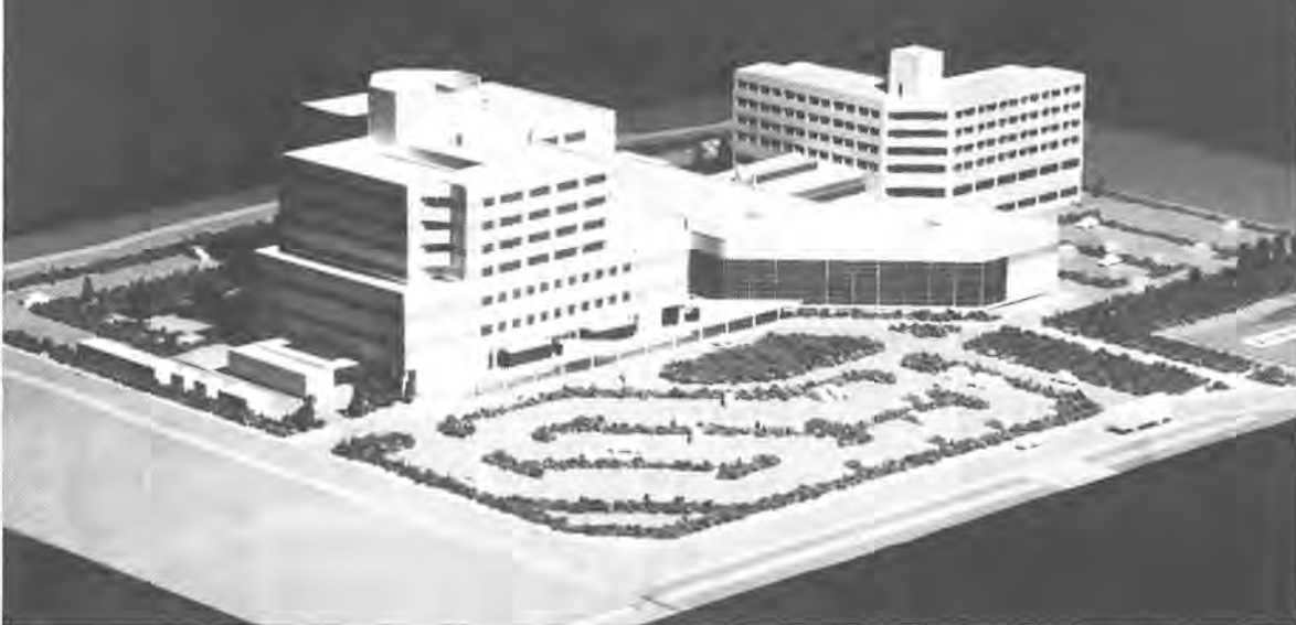
慈恵医大病院の完成予想模型(左側=病院本館、右側=看護学校と宿舎)