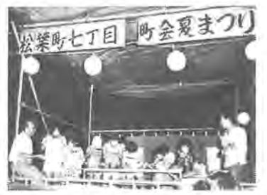
夏祭りを実施。柏むらりなどを楽しみました。

朝からの雨が、夕方になってやっとおさまった八月十一日、松葉第五公園で松葉町七丁目町会の「第三回夏祭り」が開かれました。特設のステージでは、奇術の披露や大ジョッキいっぱいに注がれ