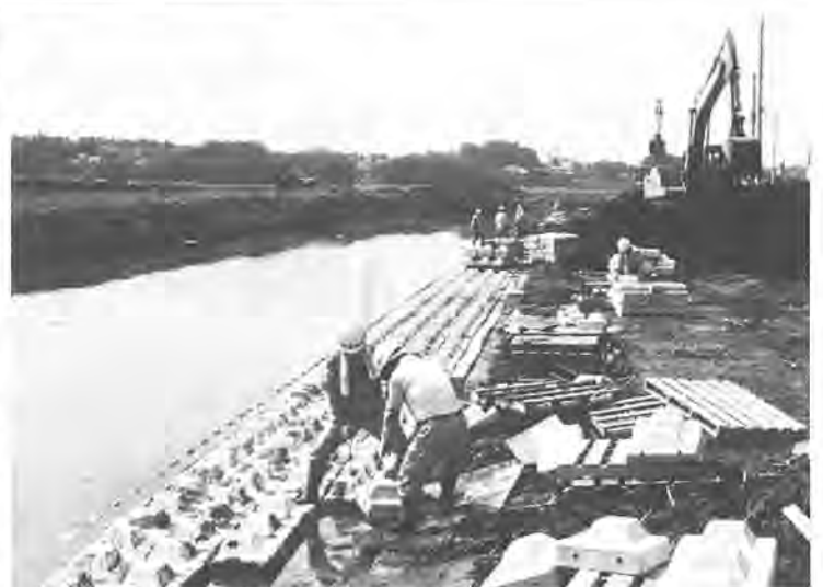
改修工事が進む大堀川下流

導水路と利根川・江戸川を結ぶ第一・第三機場で水の調整を内滞にし、さらに河川を改修することによって浸水被害を解消。また第二機場では、利根川のきれいな水を手賀沼に送り込むことによって手賀沼を浄化。さらに、水資源を確保するために、利根川と江戸川