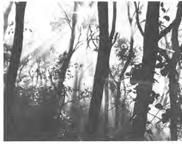
《第5回ふるさと柏写真展から》 作品はカラー