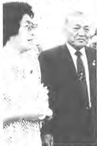
鈴木市長と語る石本長官(左)

八月八日、石本環境庁長官は、我孫子市民会館で沼田知事や鈴木市長などの出迎えを受け、手賀沼と印旛沼の水質浄化を視察しました。石本長官は、「自然を大切にしたい」、「心のつながりを大切にしたい」など、皆さんそれぞれ「ふるさと」に対して温かいイメージを描いているようでした。