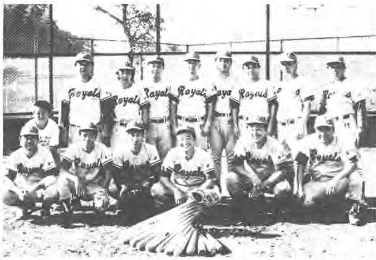
「全員野球」をモットーに、野球を楽しむ秋の台「ロイヤルズ」の皆さん