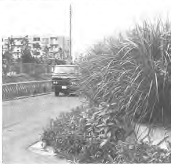
見通しが悪くなり危険な状態も

あなたの所有する「空き地」の草刈りはお済みですか。今、管理不良の空き地は、雑草が伸び放題。人の背の高さまで達してしまっています。この様な状態は、害虫の発生や不法ゴミの投げ捨てを招き、近隣の住民に迷惑がかかります。道路や歩道にせり出した雑草は、通行の妨げとなり、特に曲がり角にあっては、見通しを悪くするなどたいへん危険な状態をつくります。また、防犯上も好ましくありません。 空き地の草刈りは、土地所有者の「義務」とも言えるのではないのでしょうか。 市では、雑草が繁茂し、放置され、周囲に迷惑を及ぼすことがないようパトロールや、土地所有者への指導を行っています。また、土地所有者の便宜をはかるため、草刈り機の貸し出しを行っています。多忙等の理由により自分で刈り取りができないかたのためには、雑草等の除去業者のあっせんもを行いますので、相談ください。あなた