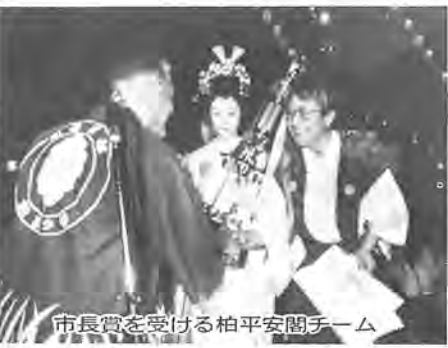
市長賞を受ける柏平安閣チーム

七月二十七日・同二十八日に柏駅前を中心に「'85柏まつり」が盛大に開かれました。注目の「こう勤務」が、柏おどりコンテ