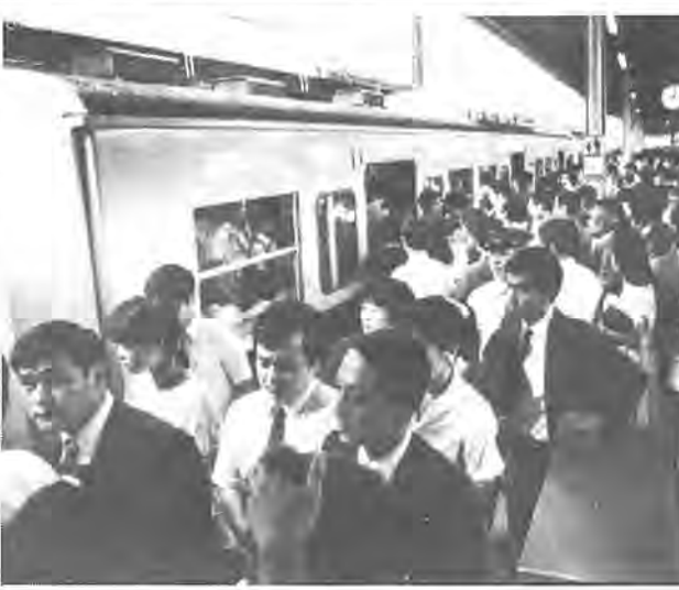
新線建設が待たれる柏駅の混雑

常磐線の輸送力増強について、昭和四十六年四月の常磐線復興に伴い乗降客が年々増加し、当