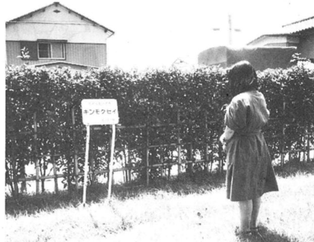
千代田町公園には、12種類の樹木を使ったモデル生け垣を展示しています

新たに生け垣を設けようという「生け垣づくり」が、プロック塀を生垣に姿「くり」利子補給制度をご利用ください。