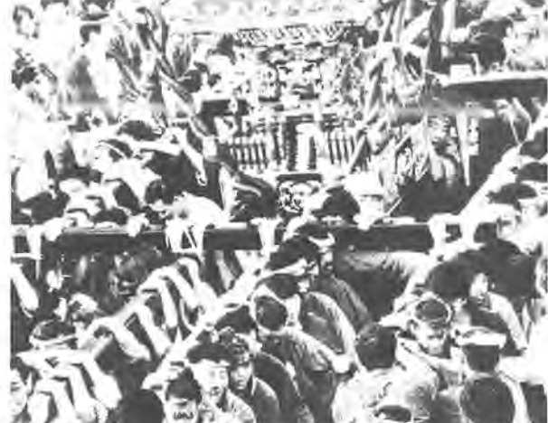
《第5回ふるさと柏写真展から》 作品はカラー

の主催で、青少年の健全な育成を 願って行われるものです。オーバ ーナイトハイイクで夏の夜を楽しん でみませんか。