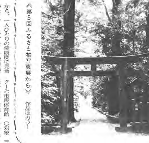
《第5回ふるさと柏写真展から》 作品はカラー

職業国民健康保険加入の有無、 加入している場合は保険証番号を お知らせください 〇問い合わせ 保険課へ