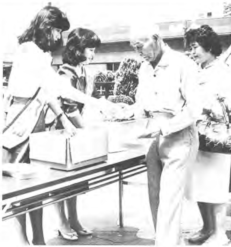
「水を大切に」と呼びかけながら、水道蛇口パッキンをミス柏と準ミス柏のお二人が配布しました

環境美化運動が二日に行われまふ。ふるさと柏を「美しい街・住みよい街」にするため、市内一斉に繰り広げられます。