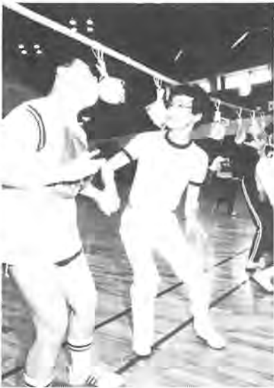
「一生懸命がんばりました」 昨年のパン食い競走から

今年も恒例の心身障害者(児)スポーツ大会が開かれます。この大会は、日ごろ交流の少ない心身障害者(児)が一堂に集い、スポーツを通して、健康の増進・機能回復とおたがいの親ほくを図る