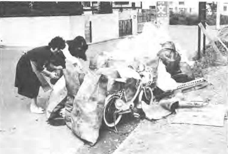
ほぼ市内全域で行われ成果が上がっている資源回収 (5月8日、松葉町七丁目)