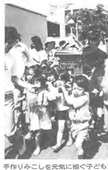
手作りみこしを元気に担ぐ子どもたち

期限までに届け出のないかたは、国と県の指導で国民年金の加入者として、年金手帳を作成し送付することになります。 なお、非該当の場合でも届け出欄にその旨を記入し、忘れずに返信してください。