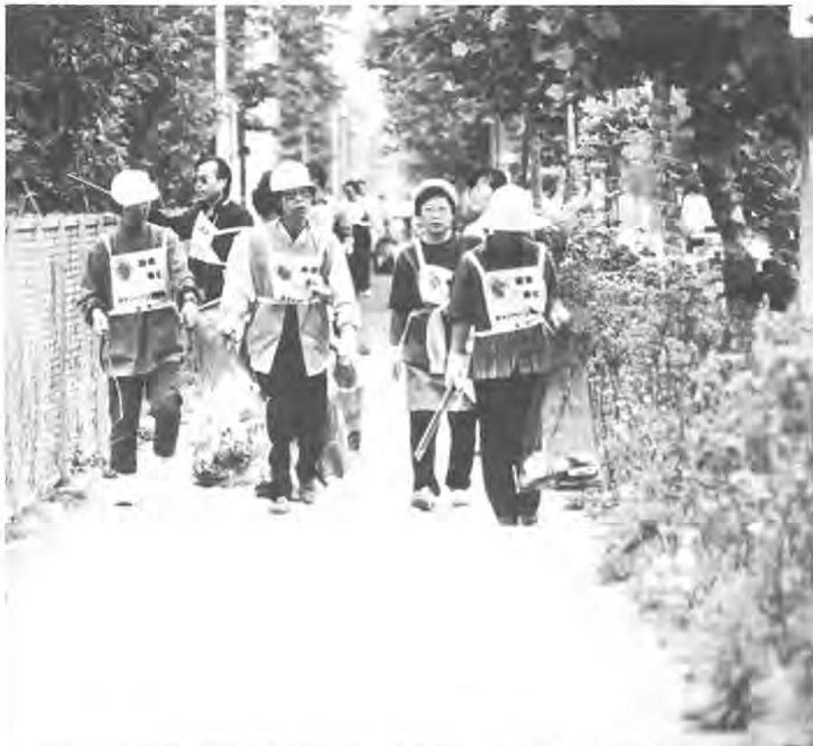
「ゴミゼロ」の願いをこめて毎年実施される環境美化運動(昨年の環境美化運動から)

「道路沿いや空き地、山林などにゴミが捨てられているのを見かけると悲しくなります」という声が市民のかたから市に寄せられることがあります。路上などへ空き缶・空き瓶などを捨てることが街の美観を損ねるばかりか、走行中の車のパンクの原因にもなりかねない危険な行為です。このことから、路上や空き地などへのゴミの不法投棄を防止し、快適な生活環境づくりに対する市民意識を盛り上げ、私たちの住んでいるふるさと柏をいっそう「美しい住みよい街」にしようとして、六月二日の日曜日、市内全域で「ゴミゼロ・環境美化運動」が繰り広げられます。