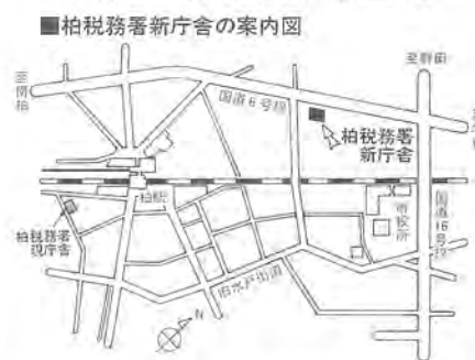
柏税務署新庁舎の案内図

柏税務署は、六月十一日から新庁舎(あけぼの二丁目1-30、☎46-1232)へ移転します。別図参照。なお、六月十日までは現庁舎(柏一丁目2-18)で執務を行っていますので、ご注意ください。 ○問い合わせ 柏税務署 ☎63-1181へどうぞ