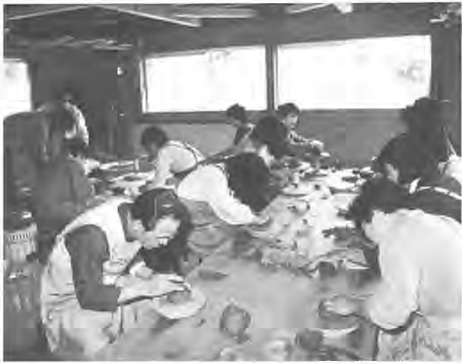
焼き物作りに夢中の木曜会のみなさん

片方の手で形を整えながら、の製作に熱中しているのは、陶器用ろくろをまわし、焼き物