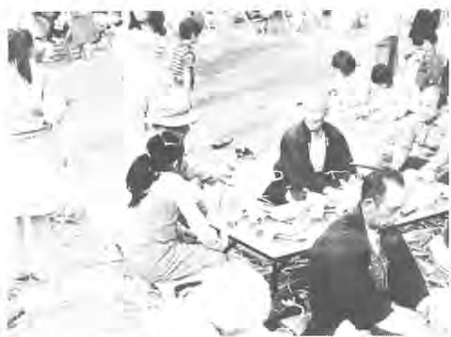
《第5回ふるさと柏写真展から》 作品はカラー