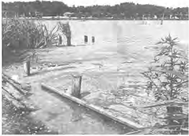
汚れがひどい現在の手賀沼 (写真展から)

手賀沼は全国で最も汚れが進んでいる湖です。市では、この現状と昔のきれいだっただころを紹介する手賀沼写真展を開きます。