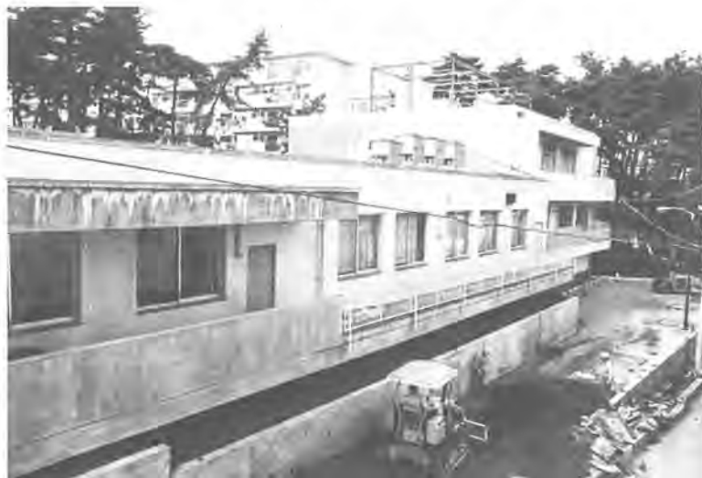
増築された豊四季台近隣センター(右側部分) = 4月11日撮影

市では現在、市民相互の連帯感や自治意識を育てるため、市内全域を十九のコミュニティ地区に