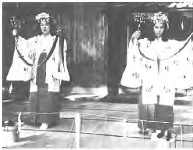
「第5回ふるさと柏写真展から」 作品はカラー