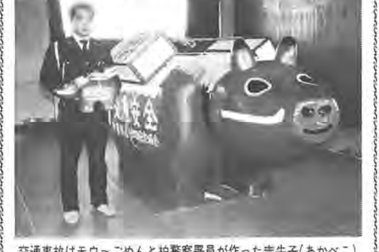
交通事故はモウーごめんと柏警察署員が作った赤牛子(あかべこ)

内容についての説明会を四月二十三日から別表のとおり開催しますので、ぜひご出席ください。 公共下水道が完成すると、トイレの水洗化ができるばかりでなく、台所などの家庭雑排水が直接下水管に流れるため、排水がドブから悪臭をも追放でき、生活環境が向上し、さらに、川や沼の水質汚濁防止に大きな力を発揮します。とりわけ柏市は、全国の湖沼の中で汚れが一番ひどいと言われている手賀沼に接し、柏市内の約八割の家屋の台所や洗濯、風呂場からの排水が手賀沼に流れ込み、沼の汚れた大きな原因になっていると言われています。これを防止するためにも公共下水道の整備は急がなければなりません。 こうして完成した下水道も、道路や公園などと同じ、下水道の整備により利益を受ける人及び地域が限定されてしまふことがありません。そこで、下水道建設にかかる費用を全額市の税金で賄うのではなく、この整備によって生活環境が向上し、土地の受益性が増加することによって利益を受ける人々に下水道建設の一部を負担していただくこととするのが、受益者負担金制度です。 柏市では、土地の状況や工事計画などに応じて、三つの負担区を設定して、負担金を算定しています。そして、この負担区の中で、三年以内に下水道整備工事を実施する予定の区域を賦課対象区域として毎年四月に公告しています。賦課対象区域になると、この区域内の土地所有者、地上権者、借地人のかたがたに受益者負担金を五分割でご負担いただくこととなります。