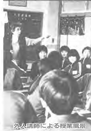
外人講師による授業風景

教育内容の充実と教育水準の向上、スポーツ・レクリエーション活動の場と機会の提供、社会教育の拠点整備、郷土文化の育成を図る、教育・文化のための主な事業は次のとおりです。 中学校建設費（中京中学校の校舎新築、逆井中学校ほか二校の校舎増築、中京中学校・田中中学校の格技場建設など） 二億一億四千六百四十四万六千元 私立幼稚園等奨励経費 二億二千二百二十七万八千元 小学校の管理経費 七億一千二百一十万元 小学校建設費（花野井小学校ほか三校校舎増築など） 四億七千七百五十三万二千元 中学校の管理経費 四億一千八百二十六万四千元 十倉二青少年広場の施設整備（用地取得費など） 三億四千二百四十四万二千元 私立幼稚園等奨励経費 二億二千二百二十七万八千元 小学校の振興備品経費 一億七千三百三十二万一千元 小学校の振興備品経費 一億二千三百一十一万四千円 中学校の振興備品経費 一億六千四百八十八万五千円 中学校の振興備品経費 一億二千三百一十一万四千円