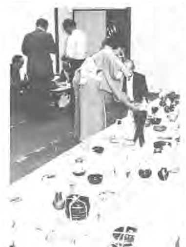
受講者の作品は柏寿荘まつりにも出品されます

問わす二十人、火・木曜日(二二回) ○申し込みはかきに①氏名の住所②年齢③性別④電話番号⑤希望する講座名を書いて、4月8日(当日消印有効)までに、〒277 柏市柏五丁目10-1 ○問い合わせ 老人福祉課へ。