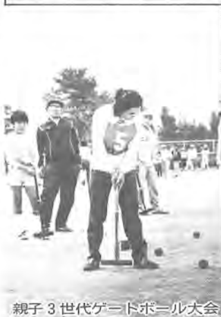
親子3世代ゲートボール大会

市民の皆さんが、心の触れ合う豊かな地域社会の中で、幸せな生活を築いていくためには、社会福祉の充実が必要です。社会福祉のための主な事業は次のとおりです。 生活保護経費（生活扶助・医療扶助・住宅扶助費など） 十二億七千三百一十万円 老人の介護経費（老人の施設収容措置費など） 二億八千五百五十四万四千元 精神薄弱者援産施設の建設経費 二億五百六十四万五千元 児童手当の支給経費 一億七千三百六十四万一千元 福祉手当支給経費（心身障害者給付など） 九千二百二十二万六千元 寝たきり老人福祉手当など 一億六千六百八十四万二千元 精神薄弱者の援産経費（精神薄弱者の施設入所措置費など） 一億六千四百八十五万円 みどり園負担金 一億二千八百九十八万八千元 保育所児童措置費負担金 九千二百五十四万九千元 敬老事業経費（敬老祝いの金） 九千二百二十二万六千元