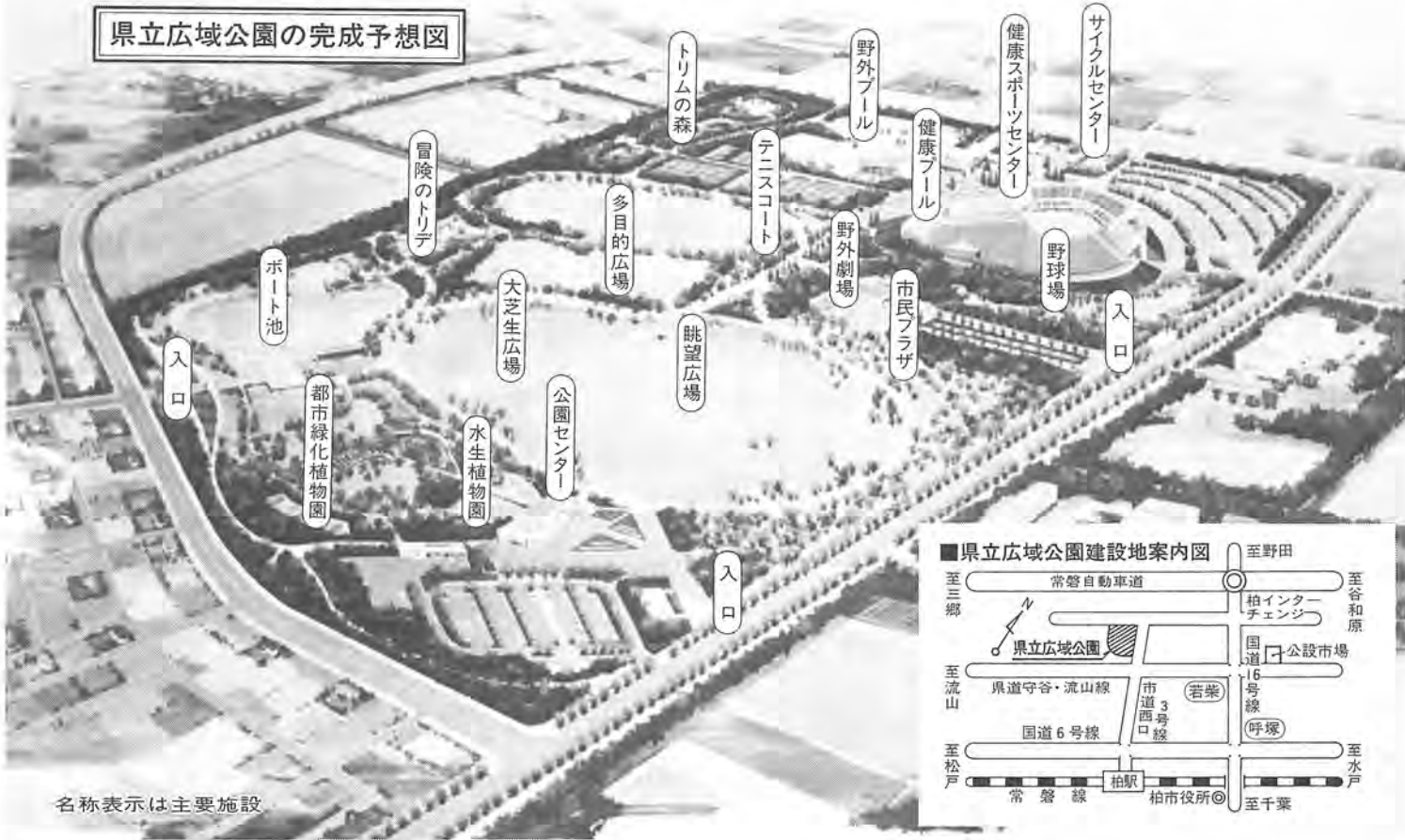
名称表示は主要施設