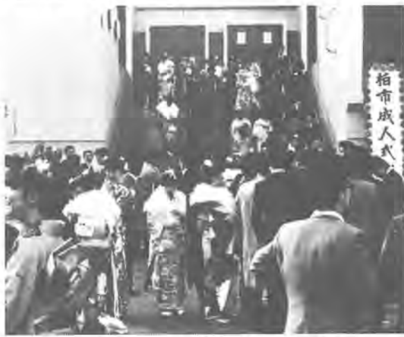
《第4回ふるさと柏写真展から》 作品はカラー

酒害相談のご利用を 旭町近隣センターで 酒害でお悩みのかた、酒をやめなければならぬかたのために、次のとおり酒害相談を開きます。 ○とき 2月6・13・20・27日