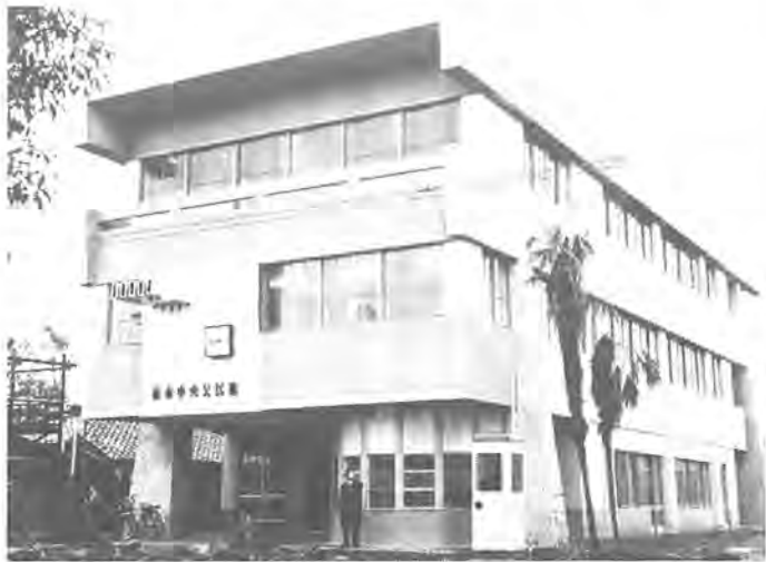
完成直後の柏市中央公民館 (現在の柏公民館)