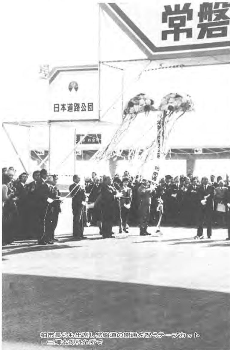
柏市長らも出席し常磐道の開通を祝うテープカット 三郷本線料金所で

一月二十四日午前零時、常磐自動車道の柏―三郷間十・八キロメートルと、首都高速6号三郷線の三郷―小菅間十・六キロメートルが同時開通し、柏市と都心が大動脈によって結ばれました。今年三月十七日、研究学園都市で開幕する科学万博に合わせ、完成を早めたと言われるこの道路。柏市や流山市では、住宅密集地を通過するため、騒音や大気汚染などの公害を心配する声が上がリ、反対運動も起こりました。このため住宅密集地では、半地下構造やふたかけ構造が採用され、ふたかけ構造部分には公園を設置し、多くの樹木を植えるなど、公害を防止するための対策がとられています。なお、開通日前日の一月二十三日には建設大臣、運輸大臣、関係都県市町村の首長など多くの関係者が三郷本線料金所と八潮料金所に集まり、両道路の開通を祝う式典やパレードを行いました。柏市と都心の時間的距離を一気に短縮する、常磐自動車道の開通は、柏市が県北の「交通要衝地」としての地位を更に高め、市北部地区の発展にも一層拍車をかけるものと期待されます。