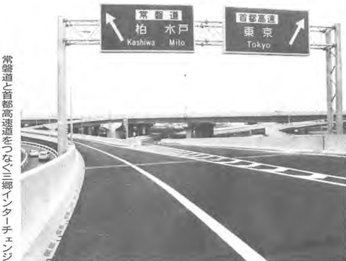
常磐道と首都高速道をつなぐ三郷インターチェンジ