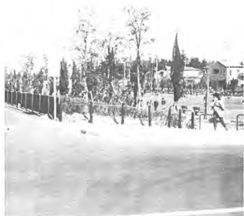
幅6.5mの側道に囲まれた、ふたかけ構造上部には、3カ所26,290㎡の公園ができました

常磐自動車道の開通を早める力ともなった、研究学園都市での科学万博は「人間・居住・環境と科学技術」のテーマを掲げ、三月十七日から九月十六日まで開かれます。国内二十八の企業・団体と四十七カ国、三十七国際機関の展示が予定される会場では、いま最後の仕上げ工事が行われています。