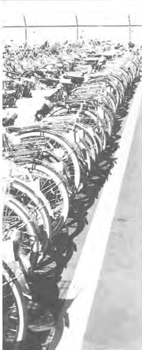
市営自転車駐車場を利用する場合は、登録をしてください