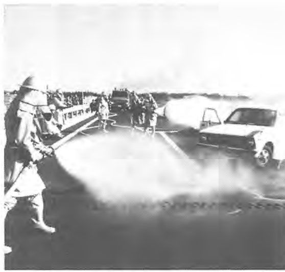
江戸川橋の上で行われた、多重衝突事故処理訓練