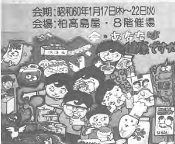
第14回みんなの消費生活展ポスターから