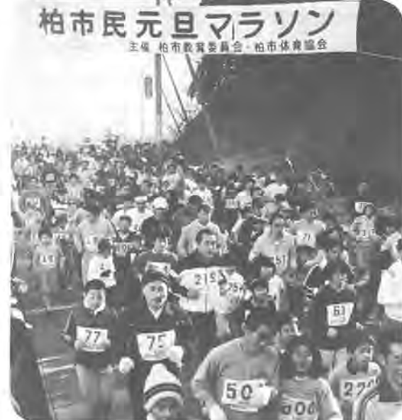
柏市民元旦マラソン 主催 柏市教育委員会、柏市体育協会