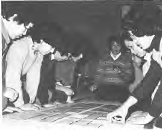
畳の上のかるたを射るように見つめる目、目、目……。みんな真剣です

畳の上に対面し目を凝らす二人の間に、みなぎる緊張。読み人の朗々とした声が流れる瞬間に魅入られた人たちが集い、昭和五十七年一月に発足したこの百人一首同好会の皆さんが、二月の例会を開き、南部近隣センターの和室にはいつも、動と静の空間が交互に広がります。 どの家庭にも、一組べらゝいはあると思われる。百人一首に魅入られた人たちが集い、昭和五十七年一月に発足したこの百人一首同好会の皆さんが、二月の例会を開き、南部近隣センターの和室にはいつも、動と静の空間が交互に広がります。