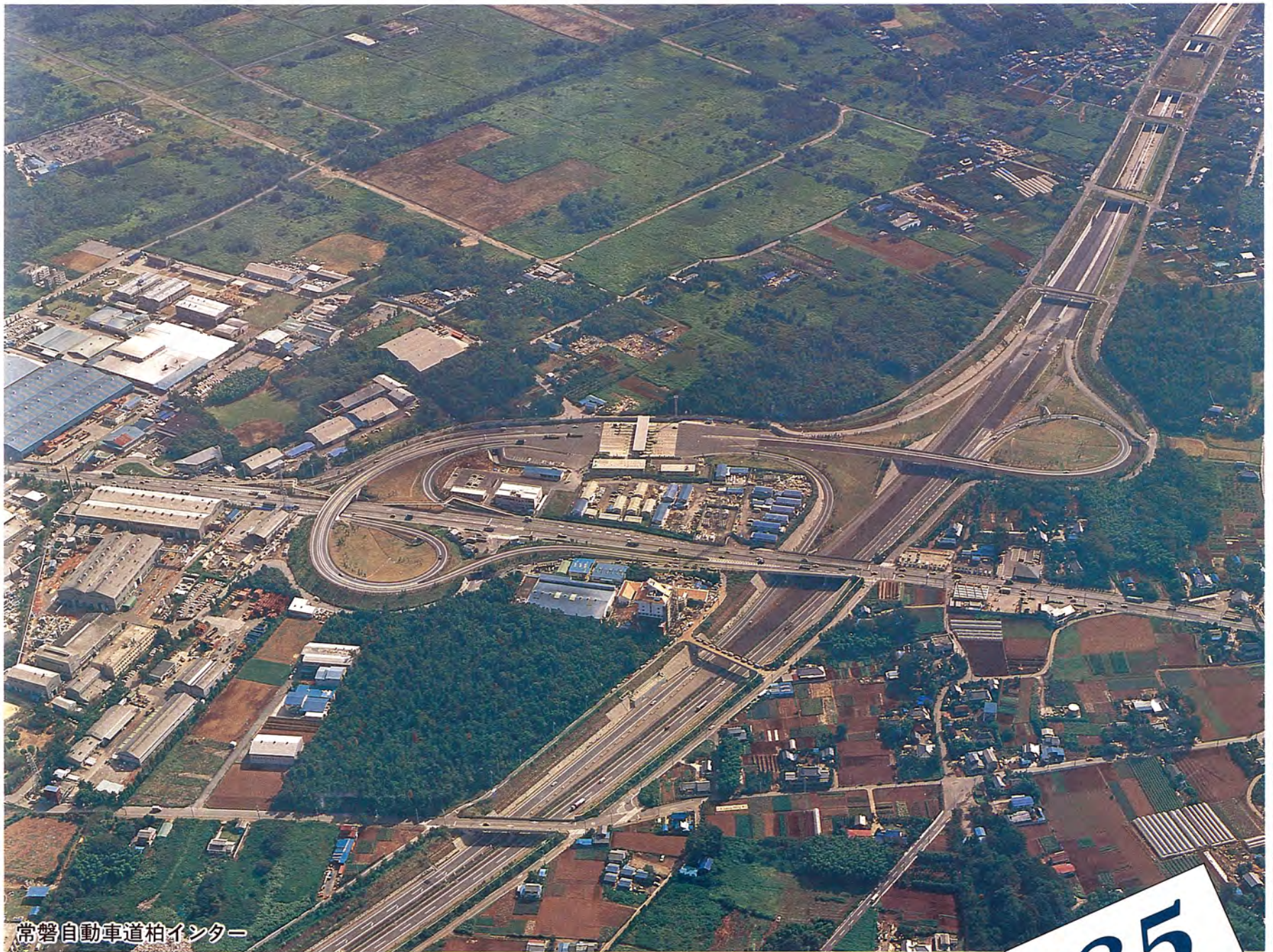
常磐自動車道柏インター