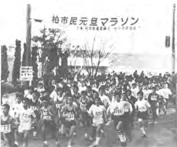
柏市民元旦マラソン