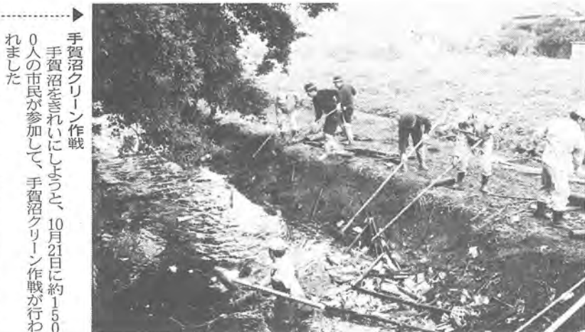
手賀沼クリーン作戦 手賀沼をきれいにしてしようと、10月21日に約1500人の市民が参加して、手賀沼クリーン作戦が行われました