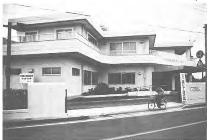
新田原近隣センター開館 10月1日、新田原近隣センターが開館。ふるさと運動を推進する施設がさらに一つ増え、近隣センターは16館に

トレーニング講習会 運動器具を使って健康づくりをしていたら、トレーニング講習会を開きます。 ○とき 12月23日(日)午前10時半から ○ところ 柏市民体育館 ○対象 市内在住・在勤・在学の高校生以上のかた、先着40人 ○費用 100円 ○用意する物 筆記用具・上履き ○申し込み 当日午前10時から、費用を添え同体育館へ直接 ○問い合わせ 社会体育課 ☎64-9573