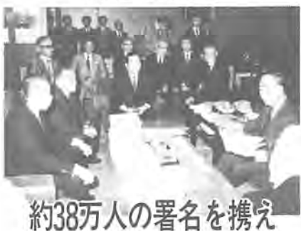
約38万人の署名を携え

柏商工会議所と流山、我孫子、沼南の線と、各商工会などが進めてきた「第二常磐線建設促進」を訴える署名運動が、このほど完了し、12月10日、三市一町の首長や、各代表らが署名簿と要望書を手交した。10月31日から11月25日までの約7週間、集めた署名は、同地域人口の約七割に達した。約375,816人。このうち柏市の署名数は、181,933人。当日は、国鉄と運輸省を訪問し、常磐線の混雑緩和には第二常磐線の建設が不可欠であるという約38万人の住民の要望を強く訴えた。