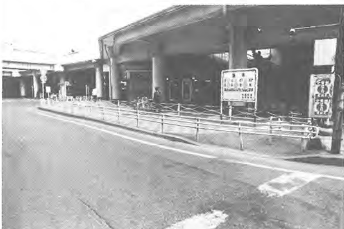
自転車条例施行 自転車条例の施行に伴い、放置自転車が道路から一掃されました

常磐新線建設促進の署名 常磐新線の早期建設への期待が高まる中、11月25日には、柏駅東口サンサン広場で街頭署名が行われました