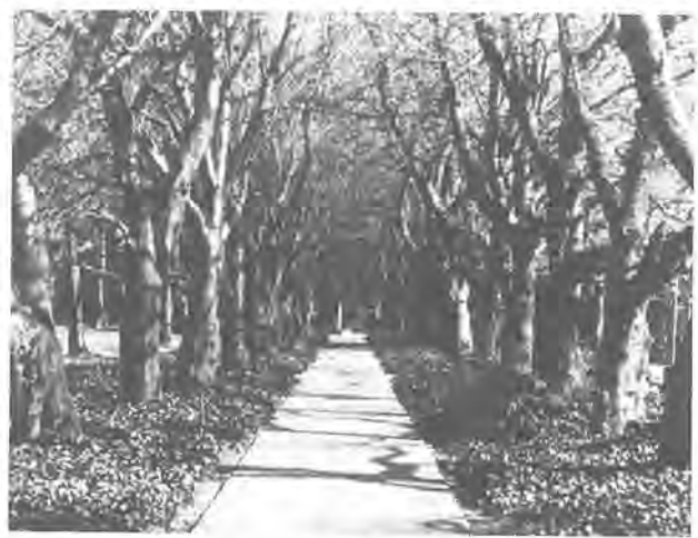
《第4回ふるさと柏写真展から》 作品はカラー

離乳食の作り方の説明と試食をする保健栄養教室を開きます。ぜひ、参加ください。 ○とき・ところ ▽11月14日(水) 千代田近隣センター ▽同15日(木) 南部近隣センター ※いずれも時間は、午後1時半から同2時半まで ○問い合わせ 健康管理課電話64-1111へ。