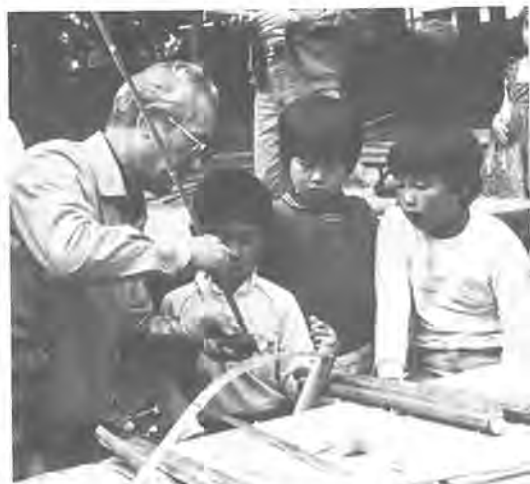
おじいちゃんが竹で豆鉄砲をつくり、それを熱心に見つめる子供たち

〇ときと内容 別表のとおり 〇ところ 教育福祉会館四階集会室 〇対象 市内在住、在勤のかた四十人 〇費用 無料。ただし教材費は実費 〇申し込みと問い合せ 11月11日(日)午前9時から中央公民館64-181-18へ電話か直接。