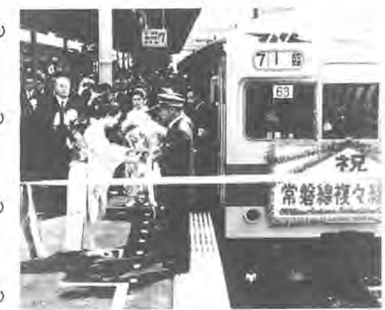
昭和46年4月20日、常磐線の複々線化とともに千代田線が乗り入れを開始。快速電車の停車は翌年10月に実現しました