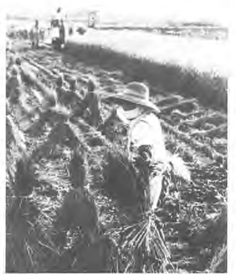
《第4回ふるさと柏写真展から》 作品はカラー

《今までに届いているかた》、母 子健康手帳・保険証など市内在住 を証明できる書類、BCG接種日 にはツベルクリン接種の際にお渡 しする問診票に記入して持参、筆 記用具、スリッパ ○受付時間 各会場とも午後1時半〜同2時半