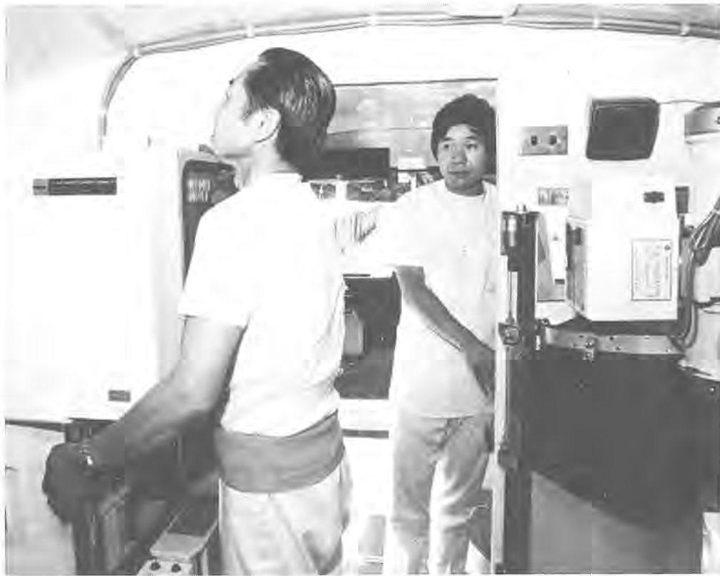
病気の早期発見、早期治療に欠かせない胸部レントゲン撮影 ＝柏市医療センターのレントゲン車で