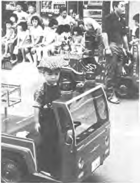
《第4回ふるさとと写真真展から》 作品はカラー