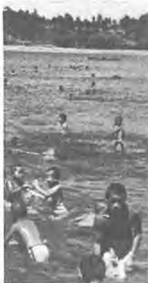
昔は手賀沼でも泳げました