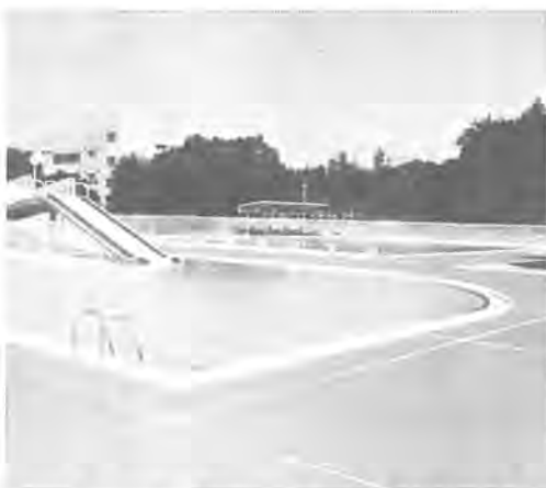
▲オープンを待つ南部市民プール