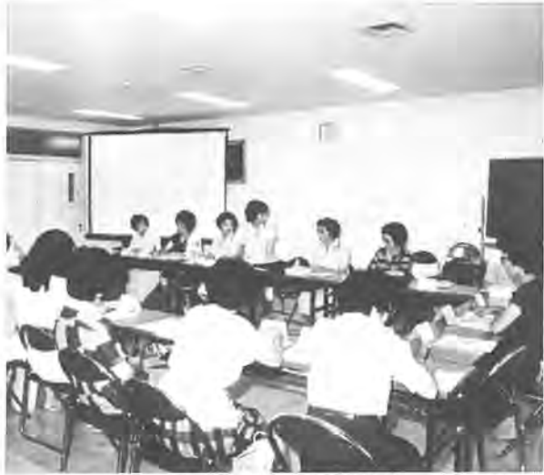
新任推進員の仕事始めは研修から ＝7月25日田中近隣センターで