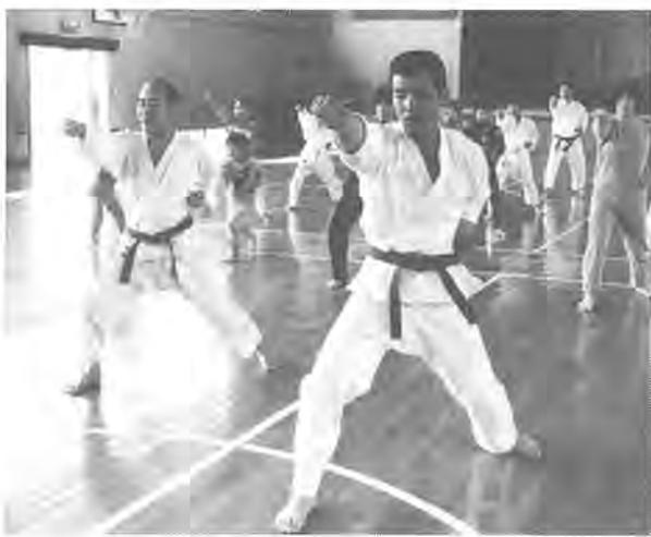
「エイノ」。突きの姿勢にも、気合いがこもります

四月二十九日はゴールデンウィーク中にもかかわらず、小学生から四十歳代のかたまで十五人が、全身を使って、空手の練習。このサークルは昨年十一月に発足したとのこと。空手を通して仲間を作り、心地よい汗を流そうと集まった面々。メンバーの中には女子高校生も。練習に入る前にまず、ボールなどを使って、筋肉や関節を軟らかくします。その後、技の体形に移ります。突き、打ち、蹴(け)りや受け身の動作になると、その一挙手一投足に気迫がこもります。