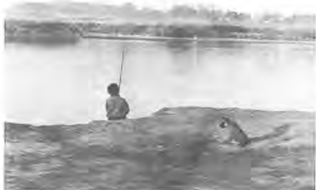
《第4回ふるさと柏写真展から》 作品はカラー