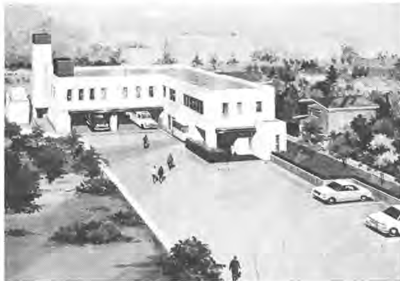
現在建設工事が進められている東部消防署光ヶ丘分署の完成予想図

今議会上程されている昭和五十九年度予算案は、一般会計が三億九千八百三十五万円で、前年比一・九％の増、水道事業会計が四億五千五百万円で前年比一九・三％増となっており、七つの特別会計