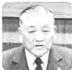
柏市長 鈴木 眞

鈴木市長は、三月定例市議会の冒頭、施政方針及び市政報告を行いました。主な内容は次のとおりです。