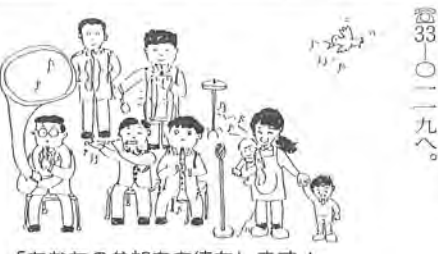
「あなたの参加をお待ちします！」

悪質業者にご注意 この時期になると、市内各地で消防器の訪問販売が行われ、そのトラブルが多くなります。中には「消防から来た、設置義務があるから」とか「消防器の点検に来た」といって、強引に買わせるケースがあります。 消防署では、各家庭に対する防火指導は行っていますが、消防器の販売を行ったり、業者に委託し