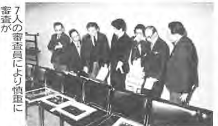
7人の審査員により慎重に審査が

申告には必ずこれだけの書類等をご用意ください。 ①申告書と認印 ②源泉徴収票や支払者の証明書など所得の明らかになる資料 ③事業所得者などのかたは、収支計算書や帳簿類 ④生命保険の支払証明書、国民年金保険料の領収書、国民健康保険 ◆問い合わせ ○市県民税 市役所市民税課へ。○所得税 柏税務署 ☎63-11818。○事業税 東葛飾支庁 ☎0473-11611-2118。